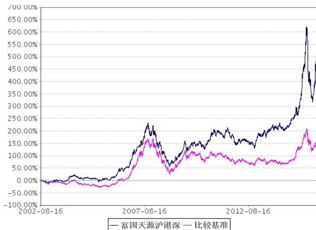
基准收益率变动的比较