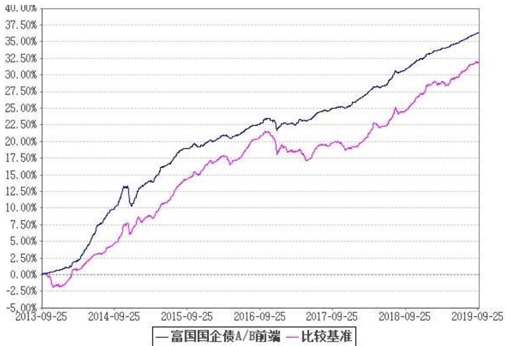
比较基准收益率的历史走势对比图